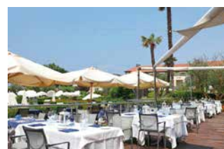
Das 4-Sterne Hotel Caesius Therme & Spa mit großzügigem Wellnessbereich liegt im malerischen Ort Bardolino am Gardasee.