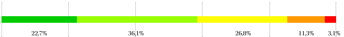
Facharzt Ausbildung: Beurteilung der Ausbildungsqualität November 2015

Die Ausbildung zum Facharzt wurde österreichweit durchschnittlich mit 2,36 bewertet.